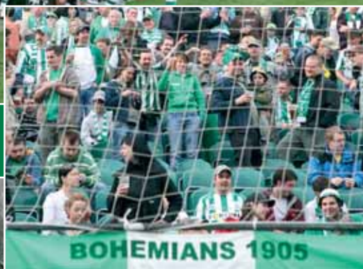
Bohemians 1905 – Vítkovice