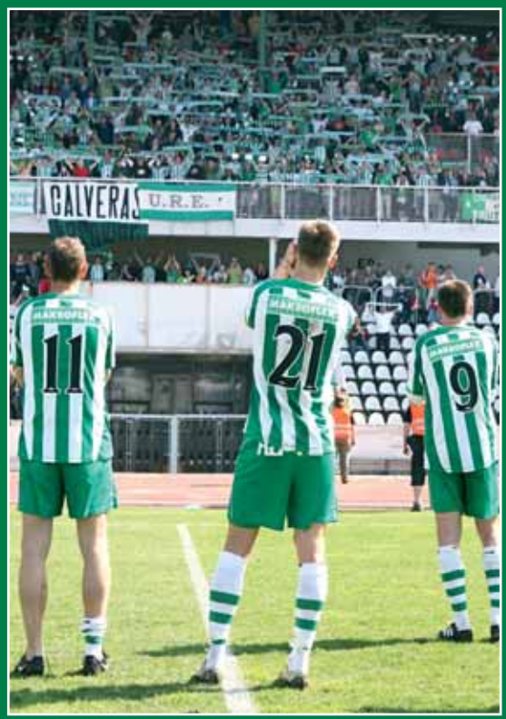
Sparta Praha B – Bohemians 1905